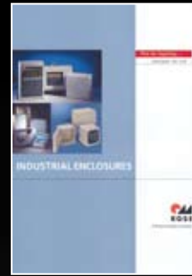
ROSE Industrial enclosures