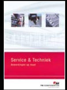
PM Service & Techniek