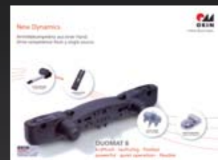
OKIN Duomat 8