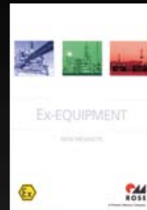
ROSE Ex-equipment (New products)